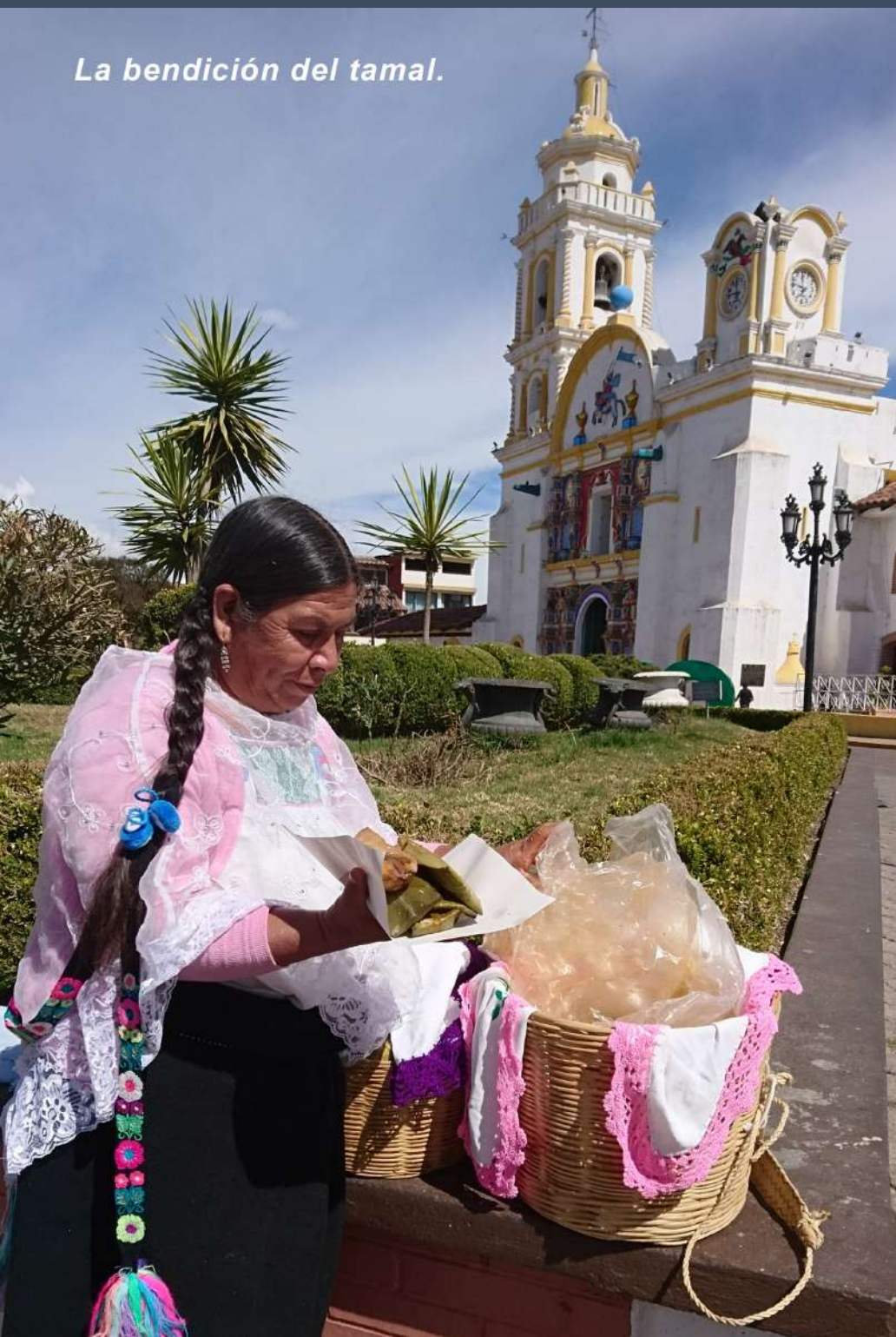
La bendición del tamal.

La Parroquia de Santiago Apóstol en el Pueblo Mágico de Chignahuapan, Puebla es el testigo fiel de la vendimia del Tamal, sus atrios se invaden de aroma y sabor al encontrar mujeres que vienen de otras comunidades para ofrecer sus productos y alagar el gusto de los turistas.